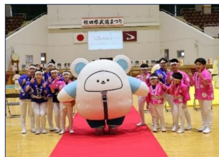
「かまくまくん」PR活動風景

公立美術大学附属高等学院の協力を得て創造されたスケート場オフィシャルキャラクター「かまくまくん」については、令和7年度に商品化を進め、手袋や縫いぐるみを製作し販売を開始しました。各種団体のイベント時などに、令和7年度に製作した着ぐるみを積極的に派遣させ、「かまくまくん」の知名度と認知度を高めるとともに、イベントの盛り上げに協力しながら、販売促進活動を実践してまいります。