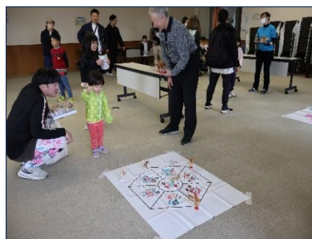
ニュースポーツ体験イベント

秋田県レクリエーション協会とは、施設を活用した各種イベントで協働しています。公社管理施設において、同協会によるニュースポーツの体験イベントなどを通じ、スポーツ・レクリエーションの普及振興とともに協働による施設の利用促進を図ってまいります。