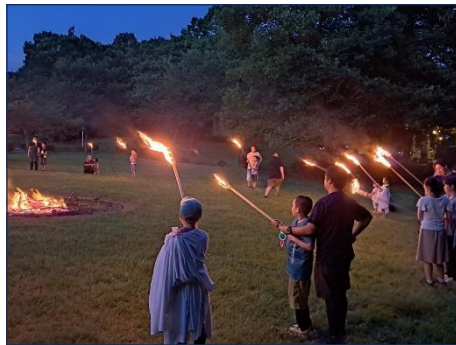
秋の思い出つくり隊(県立中央公園)