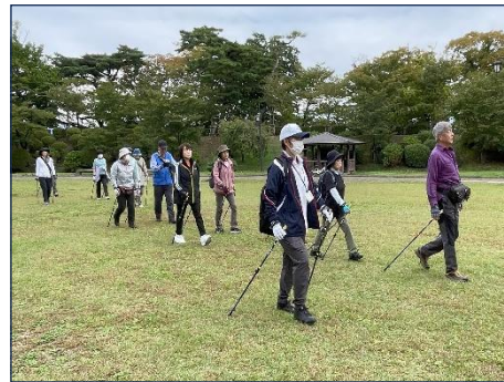
ノルディックウォーキング(県立体育館)