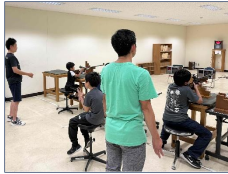
チーム対抗! ビームライフル大会(ライフル射撃場)