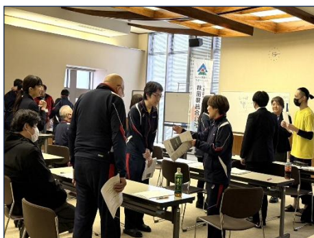
クレーム対応・カスハラ対応研修