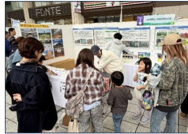
「あきたエコフェス」

環境保全センターでは、循環型社会の形成などの啓発を目的とした「あきたエコフェス」への出展などを通じ、産業廃棄物処理の意義や、維持管理しているビオトープの状況、公社の環境保全活動を県民に紹介して、環境意識の向上と社会貢献に取り組んでまいります。