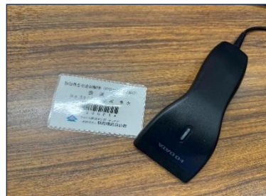
施設利用受付バーコード

令和 8 年度から会員証として受付バーコードを貼付したカードを利用者へ配布し、来場時にバーコードを読み取ることで利用受付を行い、利用者の利便性向上と受付業務の効率化を図ります。