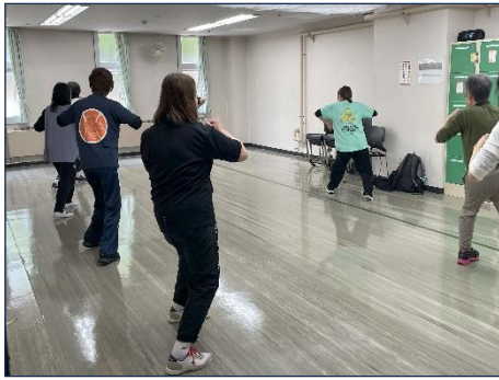
シニアからはじめるヒップホップ(体育館)