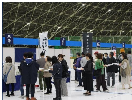
あきた一献会(県立スケート場)

野球場については、社員が阪神甲子園球場への派遣研修に参加した縁から、同球場を管理する阪神園芸株式会社より講師を招き、県内の球場管理者に芝生管理及びグラウンド整備の技術を伝える「グラウンド整備講習会」を開催いたします。こうした取組を通じ、「社会貢献」の観点からもスポーツ施設管理団体等との「協働」を進めてまいります。