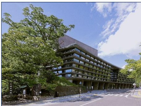
あきた芸術劇場ミルハス

あきた芸術劇場ミルハスは、令和4年6月のオープン以来、県民や市民のさまざまな文化芸術活動の拠点として、また、質の高い芸術鑑賞やワークショップなど体験の場として、多くの方々に利用されてまいりました。令和8年度は指定管理の更新申請時期に当たりますので、公社では、引き続き指定管理者の指定を目指し、あきた芸術劇場AAS共同事業体による4年間の管理運営及び興行誘致の実績、さらにはプロモーターや芸術団体・商工団体等との広範で密接なネットワークをアピールしてまいります。