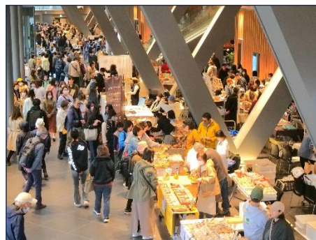
ミルハスフリー・オープン・デイ