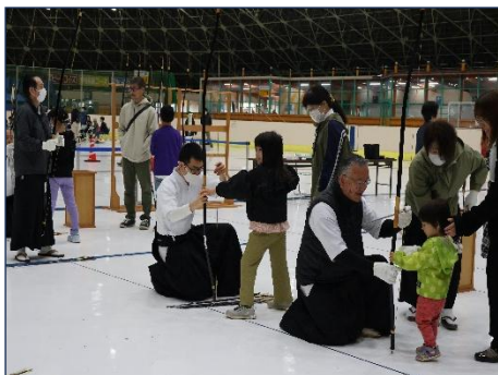
向浜こどもスタンプラリー