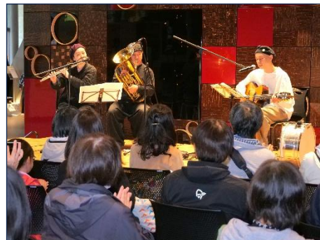
ロビーコンサート